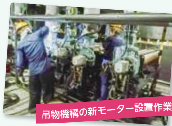
吊物機構の新モーター設置作業